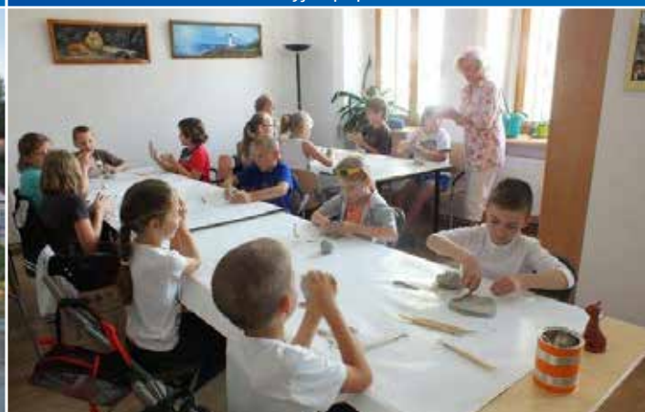
Lato w mieście z Centrum Artystyczno-Kulturalnym „Zamek” było alternatywą dla młodych krośnian spędzających wakacje w domu.