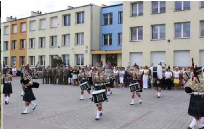
Święto 44. Wojskowego Oddziału Gospodarczego uświetniły występy artystyczne.