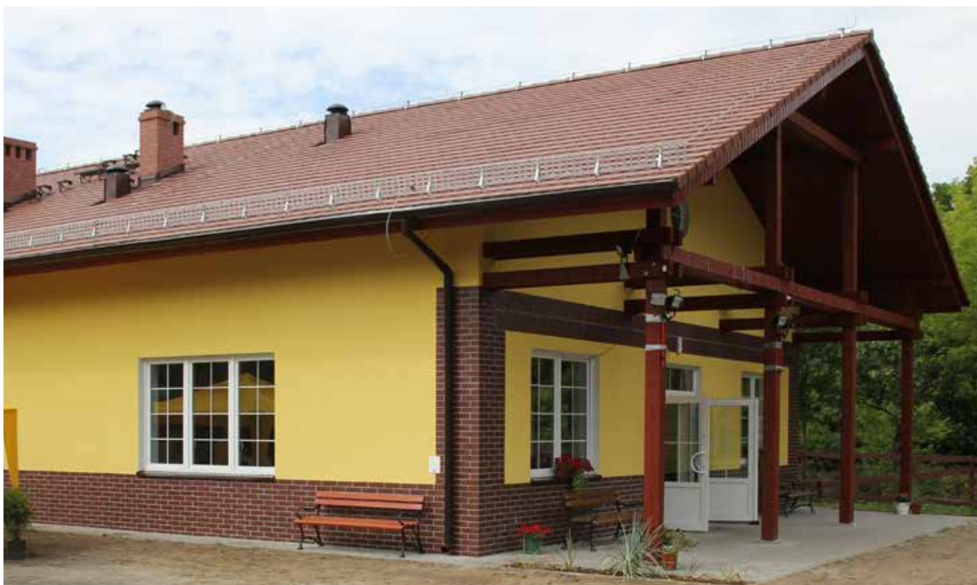
Zeszłoroczna obietnica spełniona. Świetlica w Szklarce Radnickiej służy już mieszkańcom.

Budynek liczy prawie 160 metrów kwadratowych. Główna sala ma 91 metrów, do tego kuchnia, zaplecze kuchenne, toalety (również przystosowane dla osób niepełnosprawnych) i szatnia dla personelu. Koszt inwestycji wyniósł ok. 500 tys. zł. Znaczna część tej sumy została pozyskana ze środków unijnych.