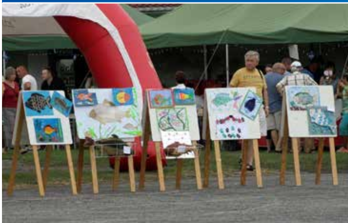
Karp już po raz siódmy królował w Osiecznicy, a goście jak zwykle dopisali.