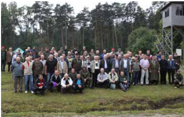
Organizowane od 16 lat rocznicowe turnieje strzeleckie cieszą się dużym zainteresowaniem wśród miłośników tego sportu.