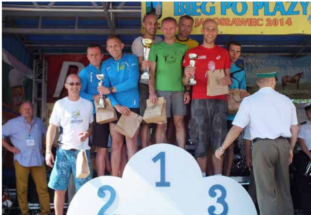
Sportowy duch funkcjonariuszy NoOSG przełożył się na rewelacyjny wynik.

miejsce, wyprzedzając drugą na podium drużynę WMOSG o 3 minuty i 24 sekundy. Trzecie miejsce natomiast zajęli funkcjonariusze Nadwiślańskiego OSG. Nagrody - puchar i upominki wręczył zwycięzcom Komendant Centralnego Ośrodka Szkolenia Straży Granicznej w Koszalinie - płk SG Grzegorz Skorupski.