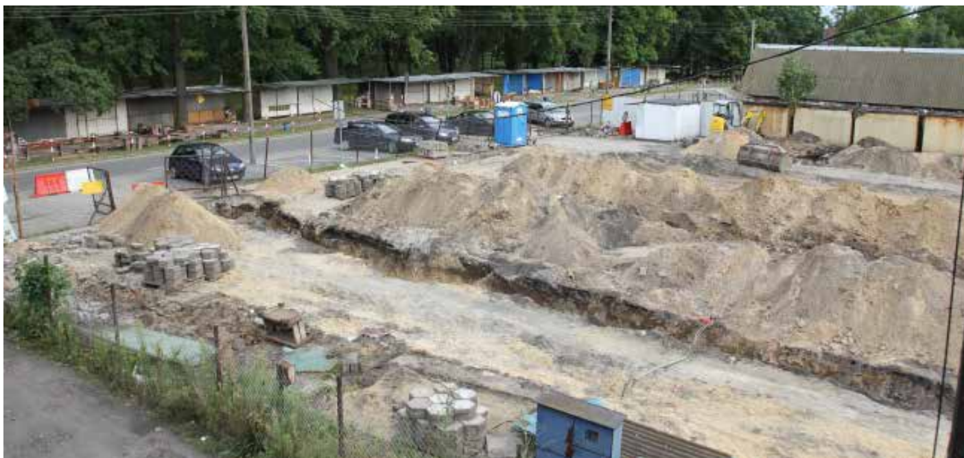
Przebudowa miejskiego targowiska niewątpliwie wpłynie na poprawę estetyki miasta.

W ramach przebudowy przewidziano m.in. wykonanie zespołów boksów handlowych w liczbie 47 sztuk, toalet ogólnodostępnych, nowego zadaszenia, ozdobnego muru, a także zatoki parkingowej. To jednak tylko niektóre zmiany, jakie już wkrótce ujrzą światło dzienne. Handlujący zgodnie twierdzą, że modernizacja