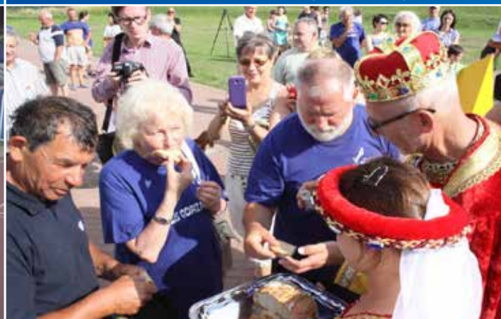
Jak co roku Flis Odrzański przemierzał Odrę. Jednym z przystanków było Krosno Odrzańskie, gdzie flisaków witała para księżęca.