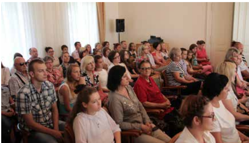
Rodziny stypendystów nie kryły dumy z wyników swoich pociech.