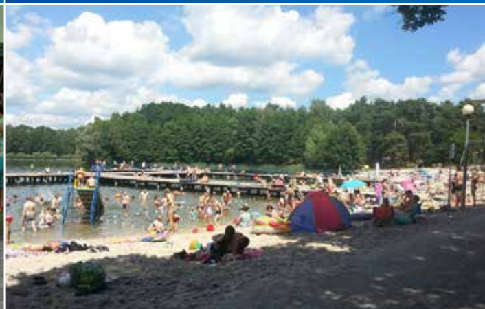
Zmodernizowana plaża nad jeziorem Glibiel przyciągała tłumy w wakacyjne popołudnia.