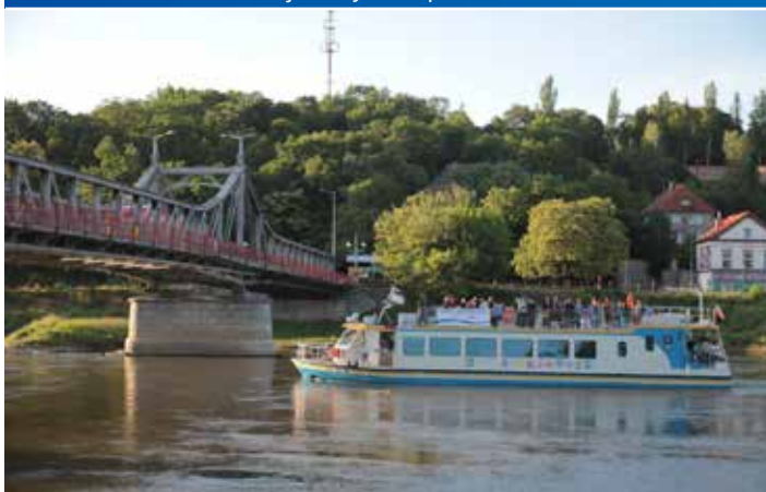
Wakacyjne rejsy Zefirem cieszyły się dużą popularnością wśród turystów i mieszkańców.