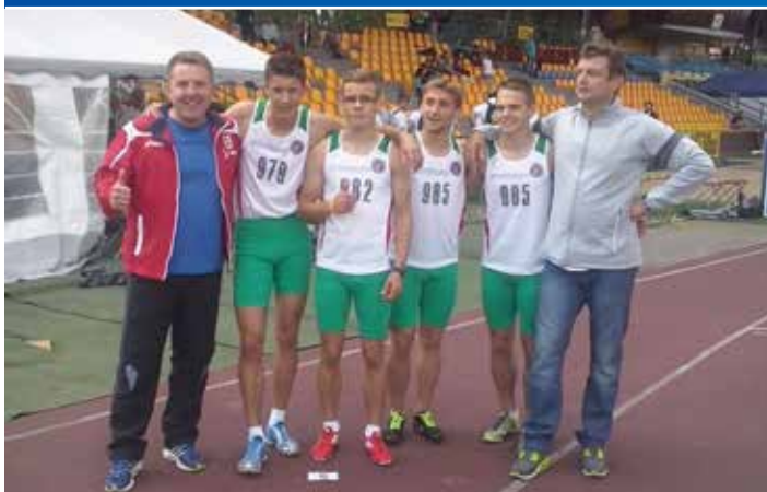
Krośnianie wicemistrzami Polski. Podczas lekkoatletycznych Mistrzostw Polski Juniorów sztafeta 4 x 400 m wywalczyła srebrny medal.